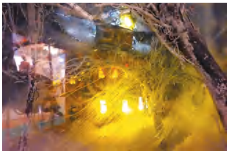
Миниатюрная инсталляция, спрятанная внутри «чемодана писателя»

В выставочном зале «Смольный» открылась детская интерактивная выставка под названием «Кто виноват? Пушкин!». Экспозиция ориентирована на детей — учащихся младших и средних классов. Вход для всех ребят — бесплатный.