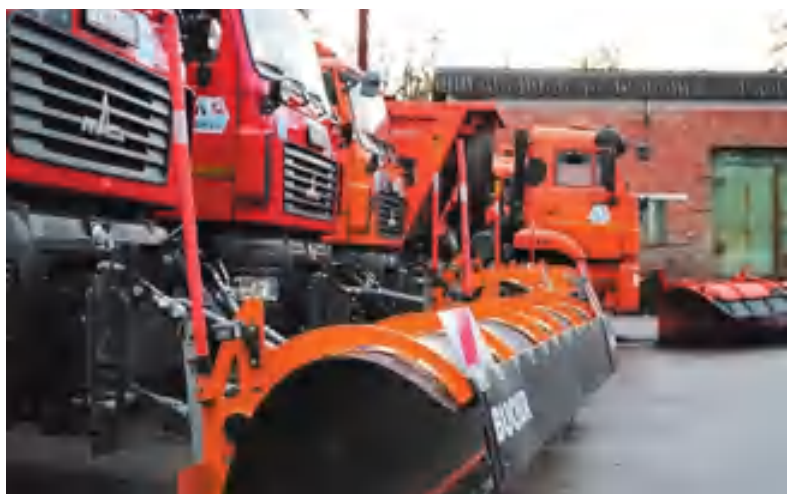
Около 500 единиц спецтехники выйдут на дороги Ленобласти этой зимой