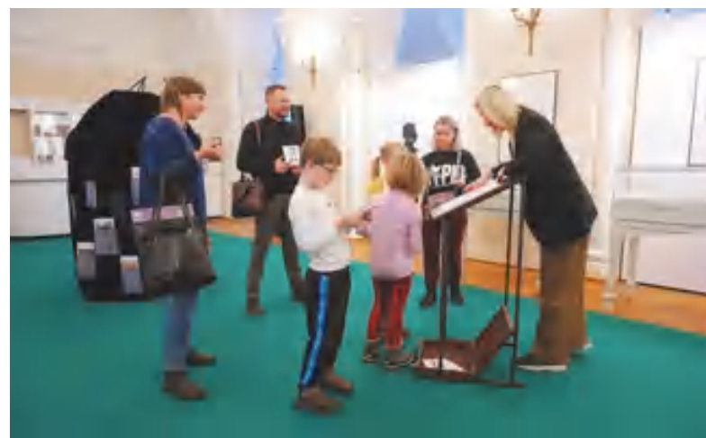
Каждый гость может оставить на выставке свое стихотворение