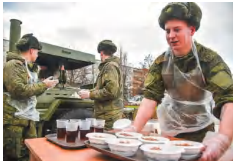
Гостей праздника угощали солдатской кашей из военно-полевой кухни