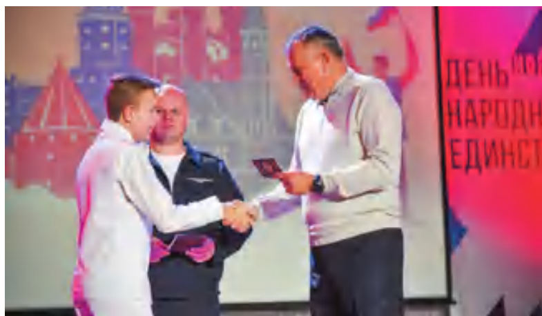
В ходе праздника свои первые паспорта получили 10 юных ленинградцев